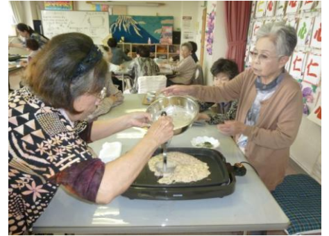
懐かし遠州焼き作って みんなで頂きました♡