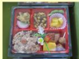
美味しいお弁当食べて