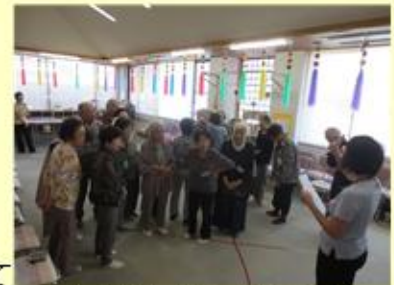
大盛り上がりの敬老会