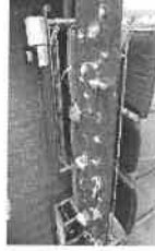
若ガエル 竹細工講座(初級)

はつらつ教室においても、過日運動会が行われ、ボール送りやパン食い競争などをし運動機能維持に努められました。これからも参加しましょうね！！