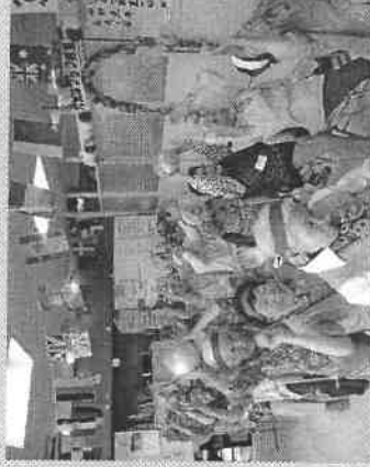
ボールを落とせば ダメですよ！