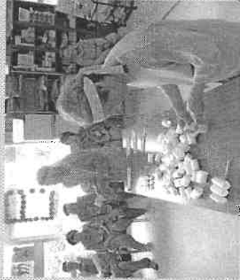
火曜日コースの皆さん