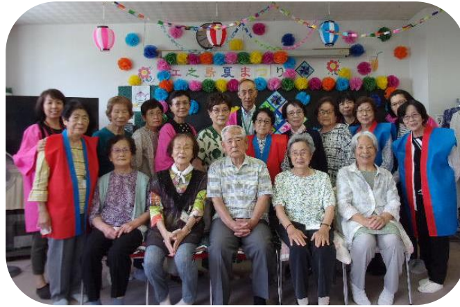
夏祭りが行われました