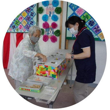
宝箱…何が当たるかな？