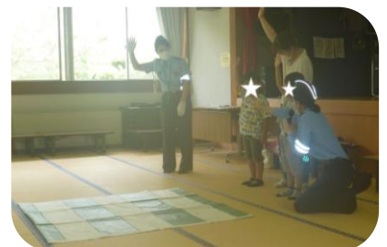
手を上げて、よく見てから渡ります