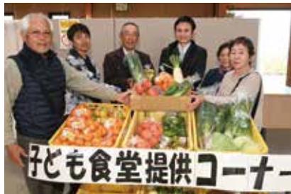
子ども食堂へ新鮮な農産物を手渡す生産者

J Aとびあ浜松の管内で採れた野菜や果物、花をはじめ、漬物や卵、加工品といった地場農産物を販売するファーマーズマーケット。「ファーマーズマーケット浜北店」では、昨年の11月から浜松市内の子ども食堂に、地域で採れた農産物を提供する活動に取り組んでいます。 提供が行われるのは月3回。普段から同店に出荷している農家さんの協力によって集めた食材を、浜北区内にある「はまはっぴー」と「きじの杜」という2か所の子ども食堂に提供しています。 多いときにはコンテナ10個分にもなります。その中身は、その地域で採れた旬の野菜や果物がメインとなるため、毎回季節感のあるラインナップが魅力です。