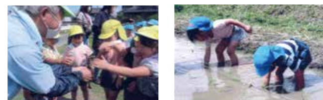
貴重な体験に園児たちも大喜び