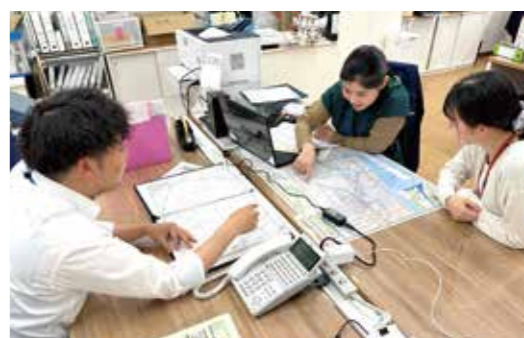
地域支援・仕組み作りに向けた話し合い