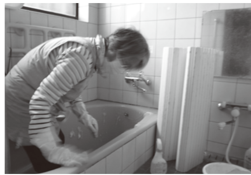
「積志ちょっとお手伝い」の様子