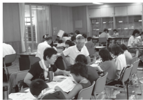
「学習ボランティア」の様子