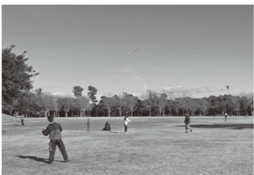
三世交代流事業「風揚げ」

一方、今年度からは子ども向けの事業にも注力。子ども食堂がスタートし、農協や民間企業個人からも、多くの寄付が寄せられています。