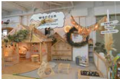
スタッフとお客さんの距離が近く、スタッフを通してつながりの輪が広がることも。木の温もりに包まれ、子育て世代がホッと息をつける空間が魅力

「鈴三材木店」は、創業から58年にわたり、地元・天竜材をメインに木材の仕入れや販売を行う会社。一般の人にはあまりなじみのない業種ですが、鈴三材木店は、街づくりの担い手として巷で話題の存在です。この会社では、「地域の資源で成り立っている会社だからこそ、地域が良くなることで自分たちも良くなっていく」という考えのもと、街と人、人と人をつなぐさまざまな事業を展開しています。 そのひとつが、体験型コミュニケーションスペースの「ホームハママツ」。ここでは、地域に暮らす子育て世代の人たちが集う場として、育児レッスンや、子どもと一緒に参加できるワークショップ、予約制キッズスペースなどを運営しています。天竜材を使ったインスタ映えする内装も相まって、クチコミやSNSでまたたく間に話題に。利用者からは、「子どもを連れて出かけられる居場所がなかったから、こういう場所があると嬉しい」といった喜びの声が寄せられています。中にはこの場をきっかけに仲良くなっている人たちもいます。 施設内では、ハンドメイド作家さんの雑貨や衣類なども販売。「いつもはイベントでの販売のみなので