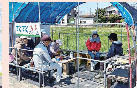
【特定非営利活動法人てくてく】 居場所事業の実施