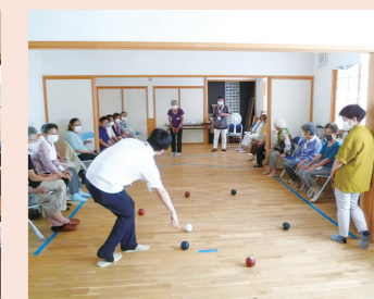
地区社協ポッチャ体験