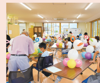
世代間交流～夏休み体験講座