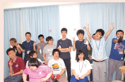
【特定非営利活動法人トマト会 トマト工房】 作業室・食堂のカーテン整備事業