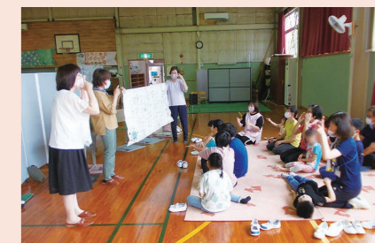
【公益財団法人浜松こども園】 ホールのカーテン整備事業