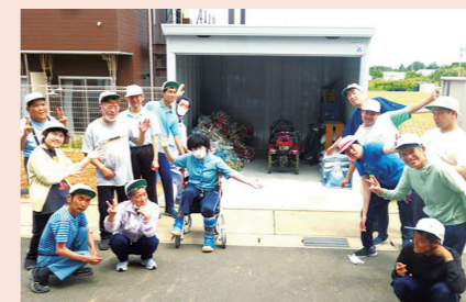
【社会福祉法人遠江学園 みなみ】 農作業用物置整備事業