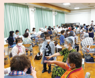
サロンボランティア講座