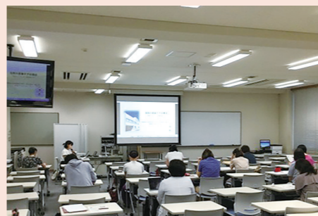
【特定非営利活動法人HEALTHY FAMILY (はままつ)】 家庭訪問員養成講座 妊産婦さんや子育て世帯への家庭訪問

静岡県内の広域(複数市町にまたがる)で活動する団体が行う福祉サービス事業及び機器整備などに活用されます。