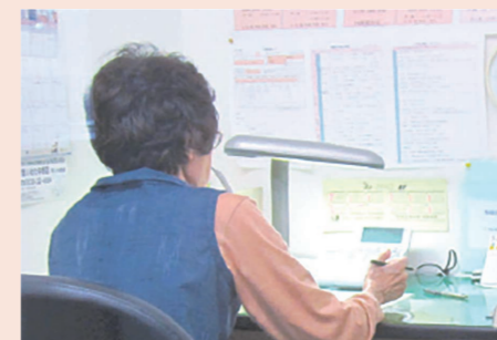
【社会福祉法人浜松いのちの電話】 相談対応