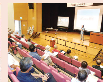
ボランティアセミナー(地域づくり講座)