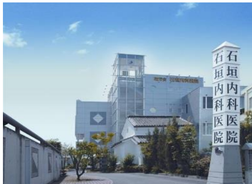
<石垣内科医院 中野町>