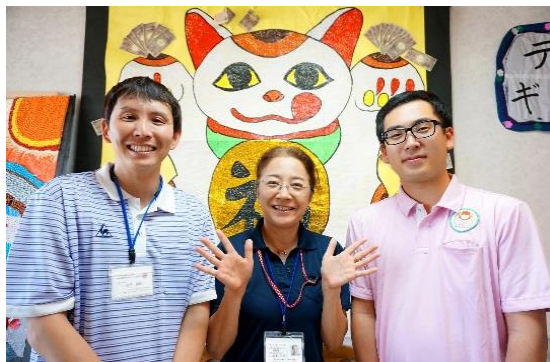
あたたかい仲間の存在が、とても心強いです！