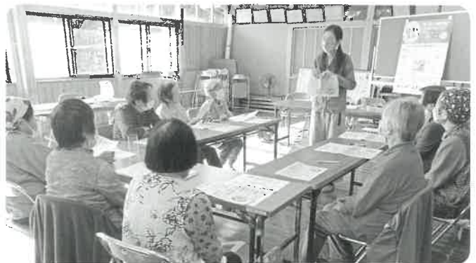
門桁サロン (ひまわり会) 今回は、栄養士さんのお話と保健師さんの健康相談でした。おしゃべりしながら楽しくお食事会もしました。