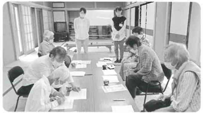
上村サロン 保健師さんのお話と健康相談。おしゃべりを楽しみながらお食事会をしました。