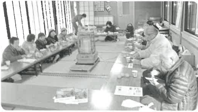
西浦サロン (よらまいか) 体操をして身体を動かした後、ケーキ作りをしました。試食をして美味しくできたケーキは持ち帰りました。おおぜい参加してくれました。