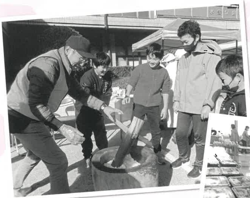
▲歳末地域交流事業の子ども餅つき