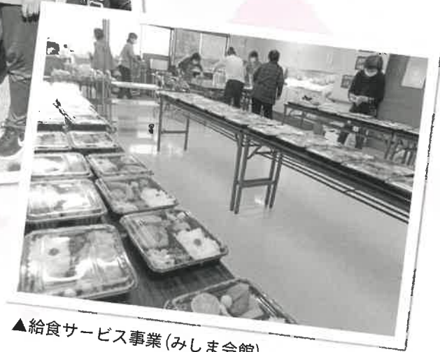
▲給食サービス事業(みしま会館)