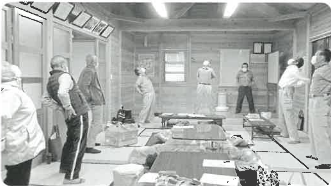
向島サロン (向栄クラブ) 体操をして身体を動かした後、栄養士さんから高齢者の献立について話を聞きました。おしゃべりを楽しみながら、お食事会をしました。