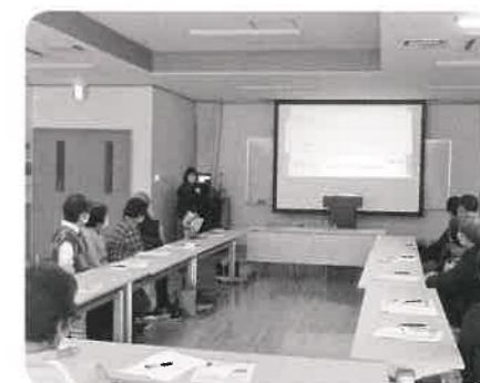
いきいきサロン代表者会議 5年度の開催状況の報告と6年度計画について協議しました。