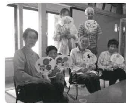
上村サロン 保健師さんのお話とうちわ作りを楽しみました。