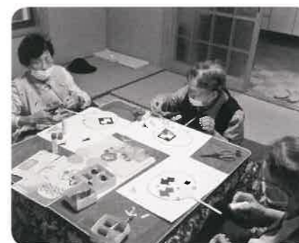
門谷サロン(やまゆり会) うちわ作りと食事会をしました。