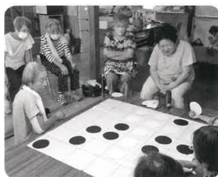
神原いきいきサロン 体操の後、布おセロやゴキブリ団子を作りました。