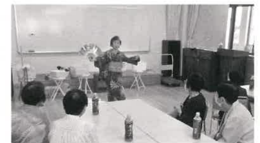
▲7月26日行われた米寿祝写真撮影会での余興の様子