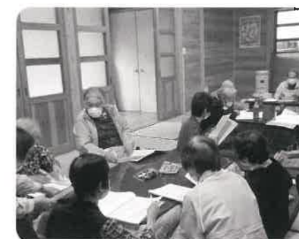
向島向栄クラブ 総会後にお食事会を楽しみました。