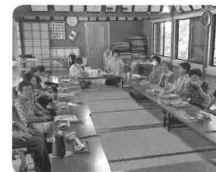
西浦サロン(よらまいか) 七夕飾りと食事会を楽しみました。