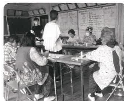
門桁サロン(ひまわり会) うちわ作りを楽しみました。