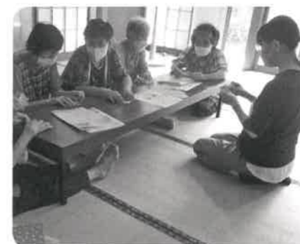
竜戸サロン(すこやか会) 折り紙や食事を楽しみました。