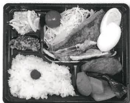
お弁当のメニューは毎回変わります。