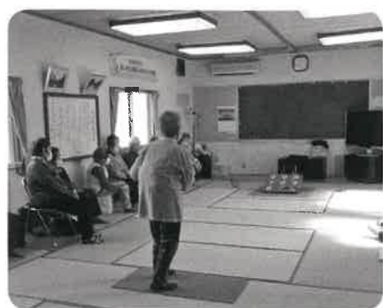
本町サロン 体操や輪投げを楽しみました。