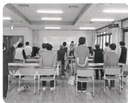
大里サロン 栄養師さんのお話を聞きました。