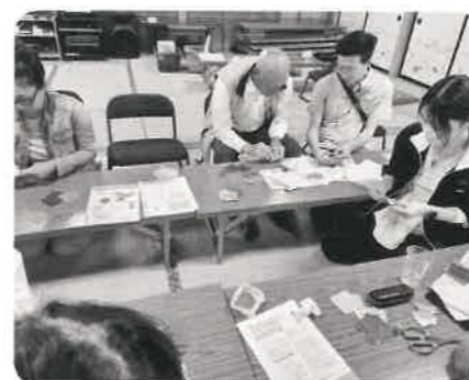
大野やまびこサロン 健康教室と食事、折り紙を楽しみました。