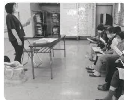
小畑サロン(なごみ会) 歯科衛生士さんから歯についてのお話を受けました。