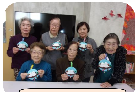
かわいいのできたね♡