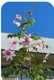
江之島の“皇帝ダリア” 昨年は大規模改修で見れず、2年ぶり！