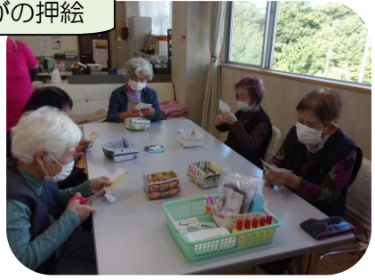
しまえながの押絵

冷気が一段と深まり、冬の訪れを感じる頃となりました。 教室では、手工芸、ゲーム、脳トレと楽しんでいます♡