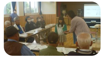
こばんはうすの皆さんと ハロウィン

多世代交流～災害時だけじゃない!!～講座で、 触れるケア・役立つ応急処置を体験しました。