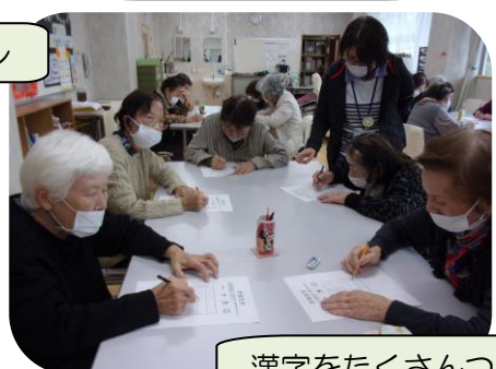
漢字をたくさんつくろう!!