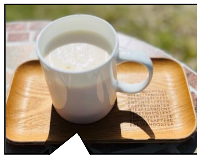
甘酒ドリンクを試飲します